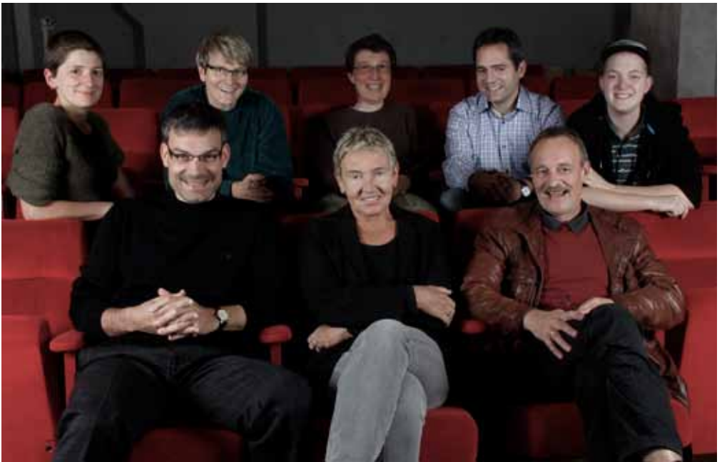
Der Vorstand des Förderkreises des Cine k